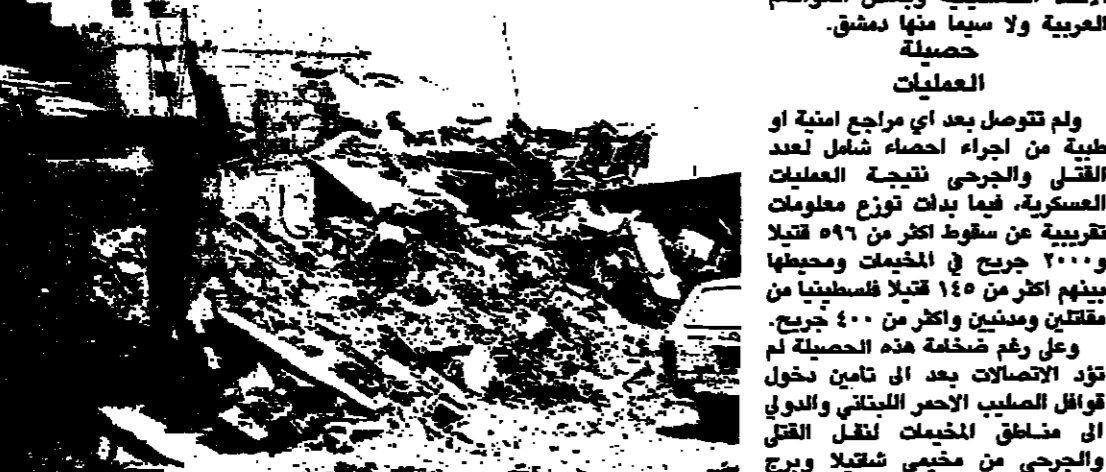
دمار في مخيم صبرا